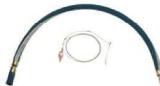
Zestaw uziemienia – zawiera 1,2m . węży z syntetycznego kauczuku w oplocie z mosiądzu 3/4" MNPT, przewód uziemienia z zaciskami -P/N 107429