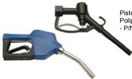
Pistolet nalewczy Polipropylen/316SS końcówka 3/4" - P/N A101497-1