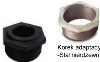
Korek adaptacyjny -Stal nierdzewna P/N 107426