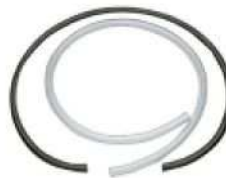
Wzmacniany wąż rozładunkowy PVC, 1,5 m. długości, 3/4"x1" P/N 107435